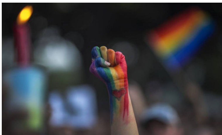
Ações serão realizadas durante todo o dia para lembrar data contra a homofobia

05/06/2017 14:45 / atualizado 05/06/2017 15:00