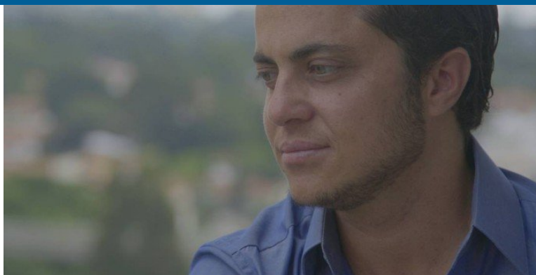
Thammy Miranda conta como foi ter sua história conhecida pelo público