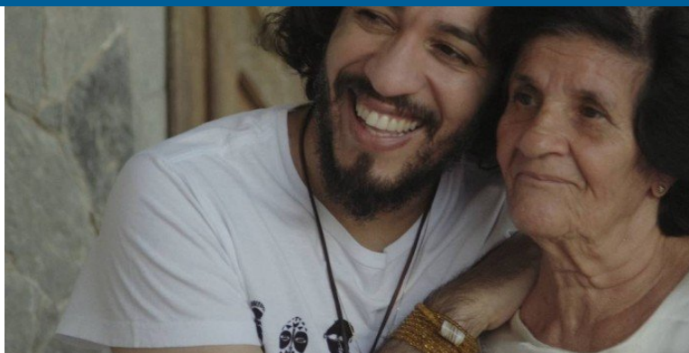
O deputado federal Jean Wyllys e sua mãe: apoio