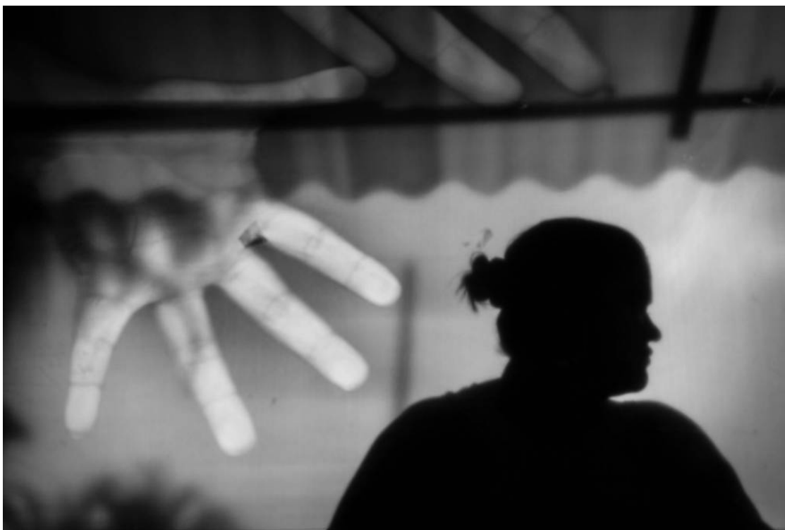
Imagem de vítima de estupro no Rio de Janeiro - Ricardo Borges - 3.jun.16/ Folhapress

CNJ excluiu nomes de mulheres e de crianças após a Folha revelar falha