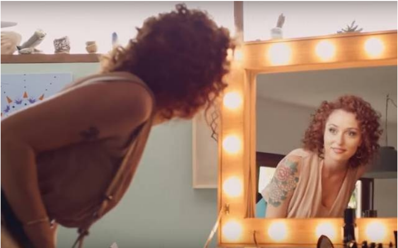
Campanha do Boticário dividiu opiniões

Uma campanha do Boticário, veiculada em 2016, dividiu opiniões entre o público. A propaganda mostrava mulheres reais e recém-separadas, que falavam sobre os motivos do término. Depois, elas apareciam maquiadas para assinar o divórcio, e a câmera focava na expressão dos homens ao vê-las arrumadas.