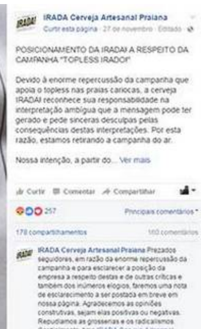
Post com pedido de desculpas da cervejaria Irada!

Outras cervejarias têm alterado o tom de sua comunicação , em resposta à mudança de recepção do público. Mas isso não significa que o problema tenha acabado. Em fevereiro de 2017, a cervejaria Irada! fez uma campanha que prometia chope grátis a mulheres que fizessem topless na praia. Nas redes sociais, a empresa foi acusada de propagar "machismo oportunista disfarçado de pauta feminista libertária" e teve que pedir desculpas. A cervejaria se desculpou.