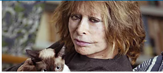
Danuza Leão: 'O Globo de Ouro me pareceu um grande funeral'